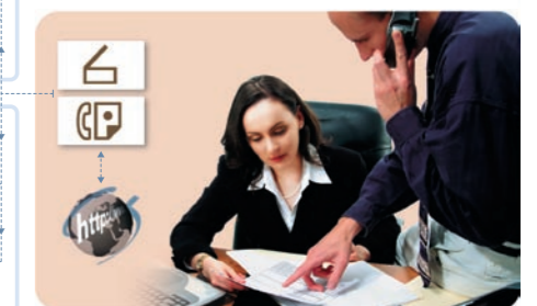
Obrázek není skutečnou fotografií a může se v podrobnostech poněkud lišit od skutečnosti.